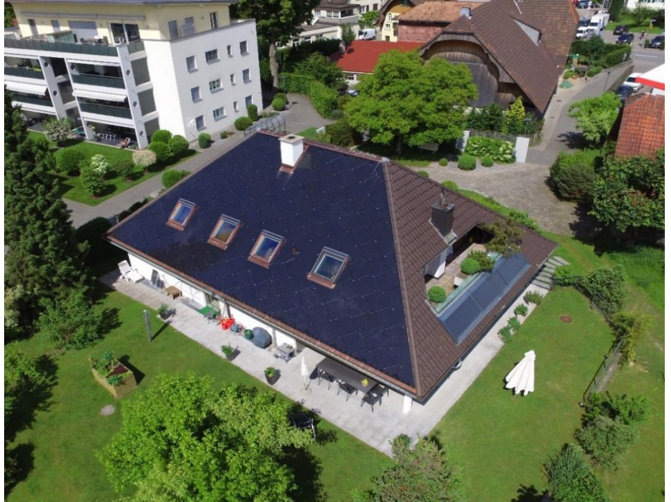
Aufnahme CKW mit Drohne

So auch der Umbau des Einfamilienhauses in Zell. Das bestehende Dach wurde durch uns abgedeckt. Es wurde vorgängig ein hitzebeständiges Unterdach erstellt und somit durften wir die Firma CKW tatkräftig unterstützen einen Haushalt mehr mit erneuerbarer Energie auszustatten.