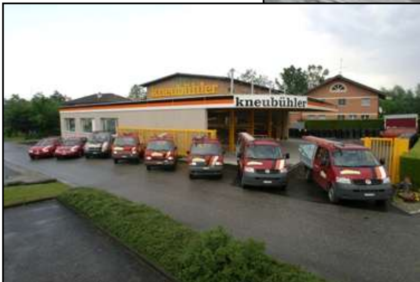
Bauspenglerei Kneubühler AG Hostrisweg 3a 6247 Schötz