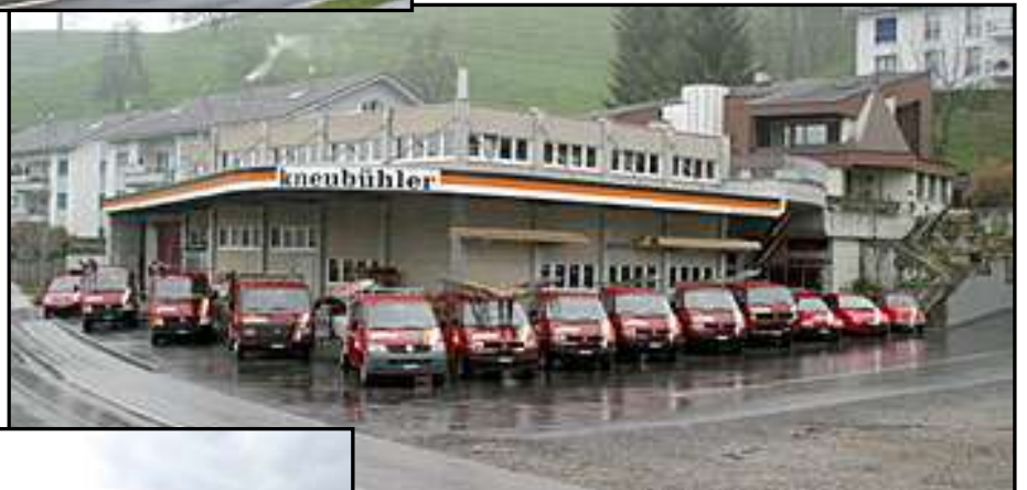
M. Kneubühler AG Weierweid 1 6122 Menznau