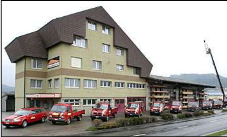
M. Kneubühler AG Industriestr. 15 6252 Dagmersellen